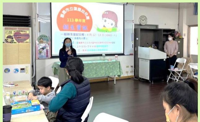
▲提供優先入幼兒園資訊