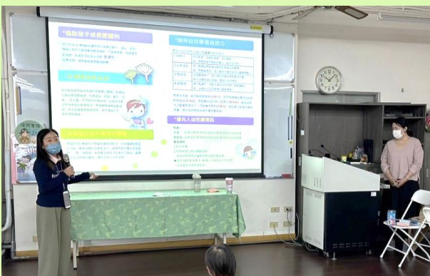
▲提供親職教養相關資訊