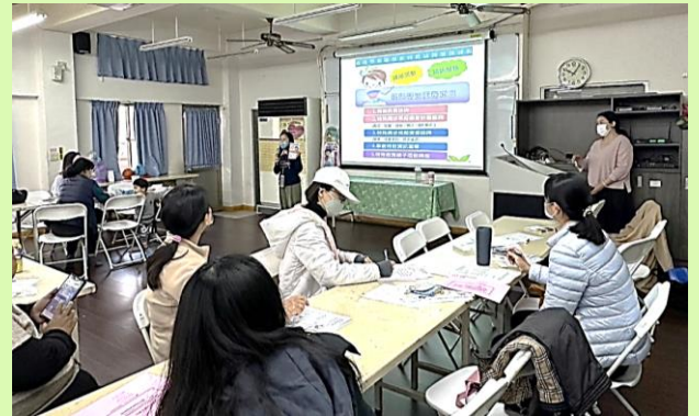
▲介紹據點功能及服務內容