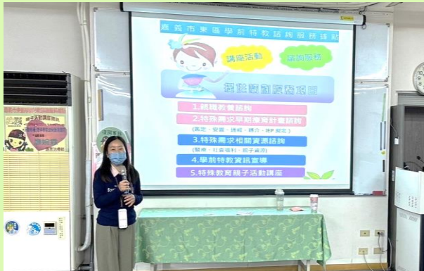
▲特教據點宣導可提供資源