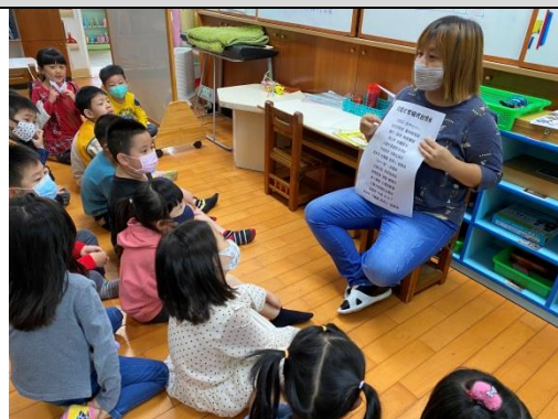
照片說明：練習唸歌詞 拍攝日期：109 年 04 月 08 日