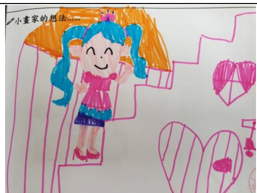
照片說明：小朋友畫「安全行樓梯」的圖 拍攝日期：109 年 04 月 06 日