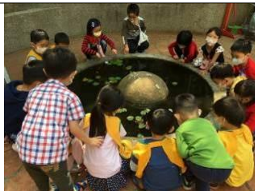
照片說明：色水跳入去魚池仔變青色 拍攝日期：109 年 04 月 10 日