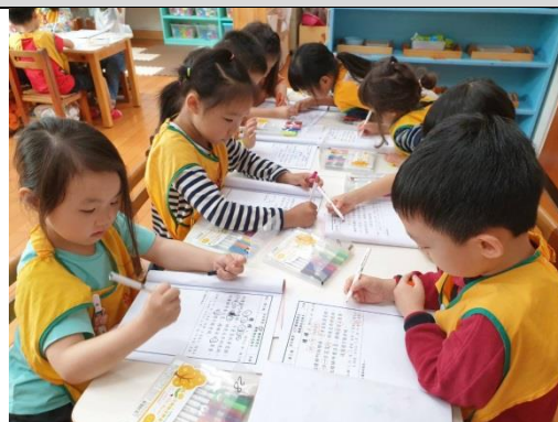
照片說明：認真畫圖 拍攝日期：109 年 04 月 06 日