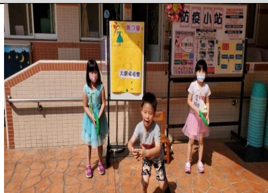
照片說明：小朋友認真的介紹及說明 拍攝日期：109 年 04 月 06 日