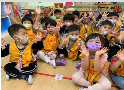
照片說明：熟似我的手 拍攝日期：109 年 4 月 1 日