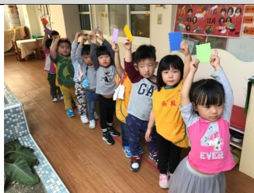
照片說明：準備出發揣色水囉！ 拍攝日期：109 年 04 月 15 日