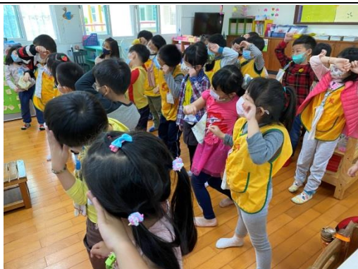
照片說明：練習律動 拍攝日期：109 年 04 月 09 日