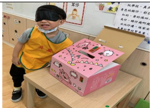
照片說明：神秘箱仔 拍攝日期：109 年 4 月 14 日