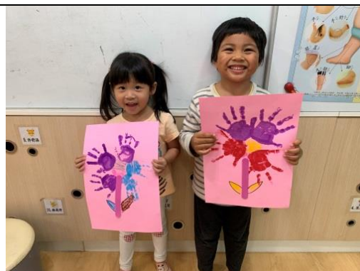
照片說明：我的手面花 拍攝日期：108 年 4 月 21 日