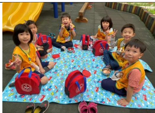
照片說明：因仔佢好朋友做伙野餐 拍攝日期：109 年 4 月 6 日