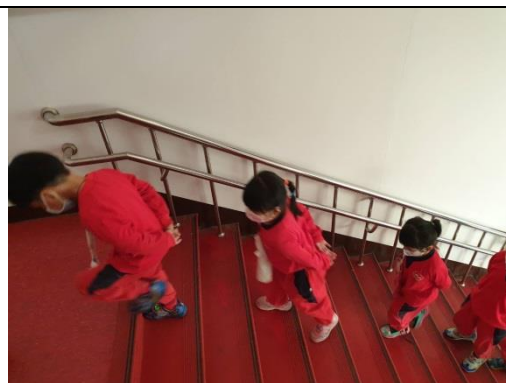
照片說明：阮會曉勻勻仔行樓梯 拍攝日期：109 年 04 月 14 日