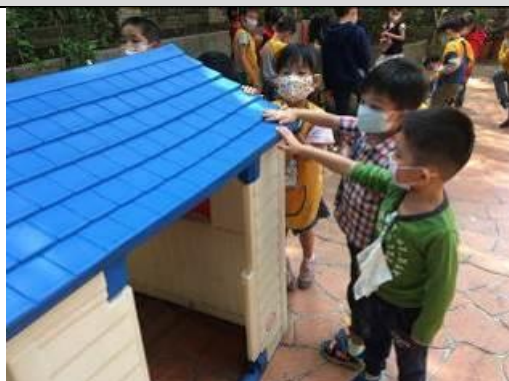
照片說明：色水跳去厝頂變藍色 拍攝日期：109 年 04 月 07 日