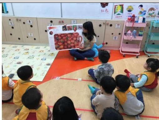
照片說明：老師分享色水的冊。 拍攝日期：109 年 04 月 13 日