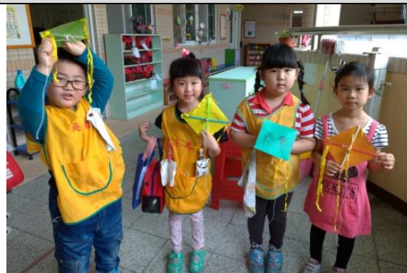
照片說明：因仔完成家己的風吹 拍攝日期：109 年 4 月 6 日