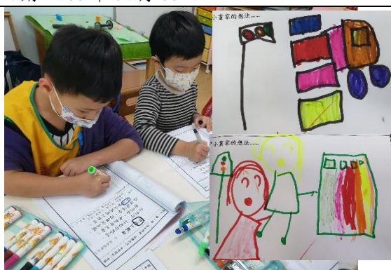
照片說明：圖出「平安」恰佇大路愛細膩的安全畫面 拍攝日期：109 年 04 月 09 日