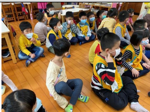
照片說明：安靜聽歌曲的內容 拍攝日期：109 年 04 月 06 日