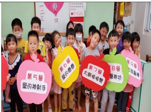
照片說明：小關主們作伙介紹關卡名稱 拍攝日期：109 年 04 月 9 日