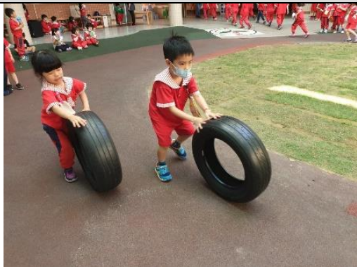
照片說明：車子起程！保持距離以策安全 拍攝日期：109 年 04 月 01 日