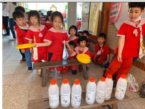
照片說明：愛的神射手 拍攝日期：109 年 4 月 6 日