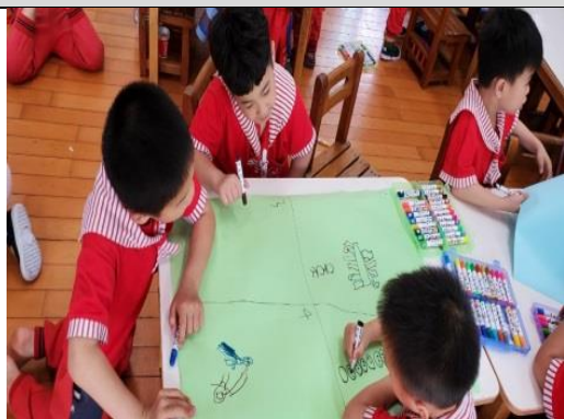
照片說明：設計飛盤關活動步驟 拍攝日期：109 年 04 月 01 日