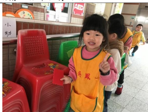
照片說明：老師你看我揣著紅色！。 拍攝日期：109 年 04 月 17 日