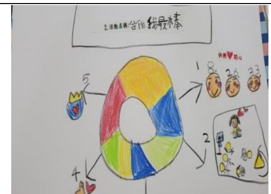
照片說明：閩關活動~心智圖製作 拍攝日期：109 年 04 月 10 日