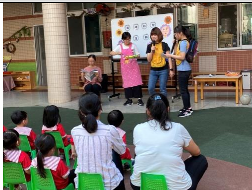
照片說明：因仔看「清明節令宣導」戲齣 拍攝日期：109 年 4 月 1 日