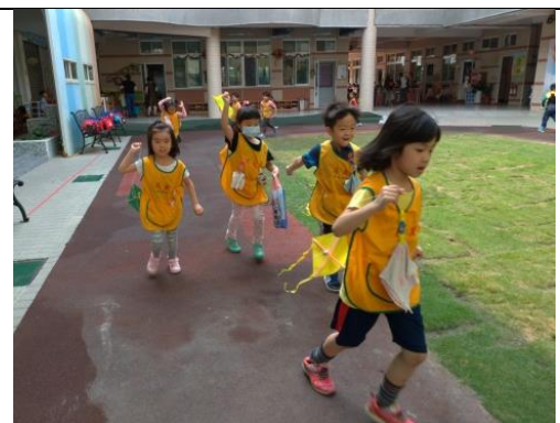
照片說明：因仔佇試看覓，欲按怎讓風吹飛起來 拍攝日期：109 年 4 月 6 日