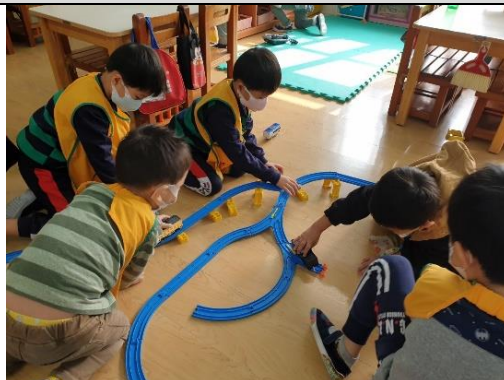
照片說明：查埔囡上愛車子軌道組 拍攝日期：109 年 04 月 06 日