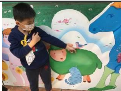
照片說明：色水跳去鳥仔身軀變桃仔色 拍攝日期：109 年 04 月 07 日