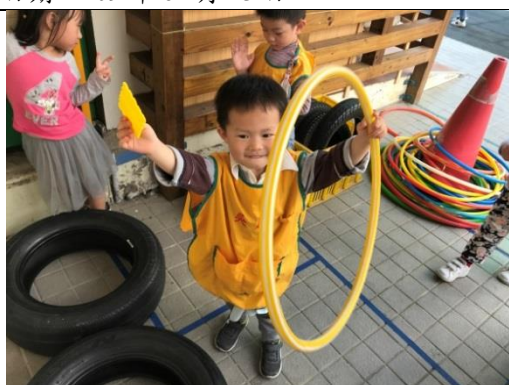
照片說明：老師你看我揣著黃色！ 拍攝日期：109 年 04 月 17 日