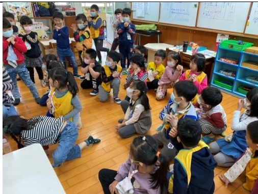
照片說明：變換隊形 拍攝日期：109 年 04 月 13 日