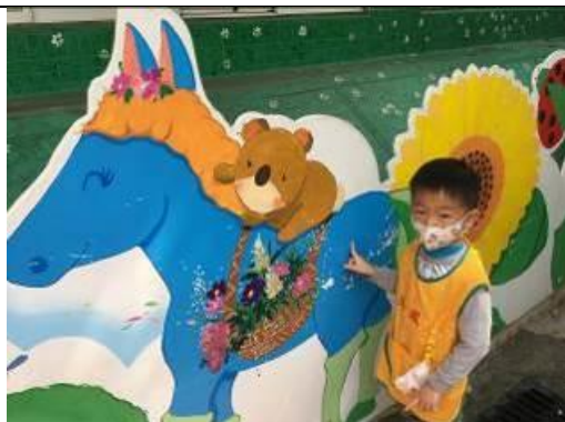
照片說明：色水跳去馬身軀變藍色 拍攝日期：109 年 04 月 09 日