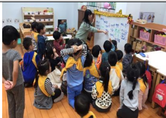
照片說明：逐家作伙數票數 拍攝日期：110 年 03 月 03 日