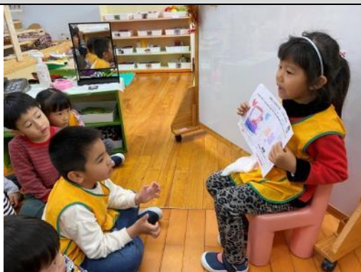
照片說明：囡仔到台前分享主題學習單 拍攝日期：110 年 02 月 25 日