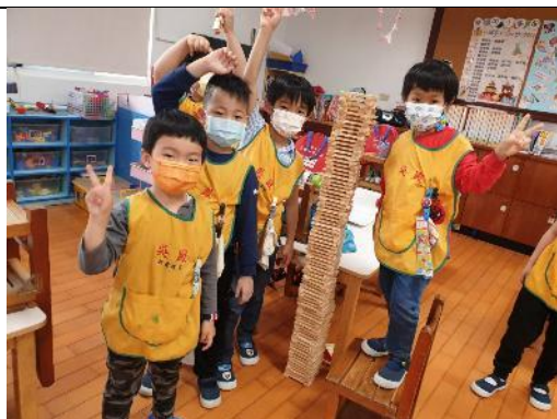
照片說明：一百空一層大樓 拍攝日期：110 年 03 月 11 日