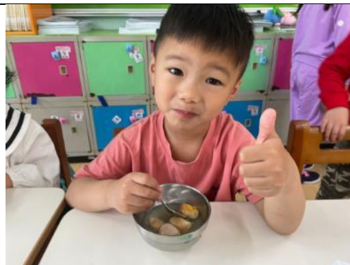
照片說明：朋友攞講家已做的元宵湯真好食 拍攝日期：110 年 03 月 02 日