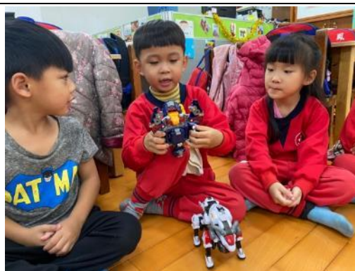
照片說明：囡仔輪介紹家己的迺迺物仔 拍攝日期：110 年 03 月 09 日