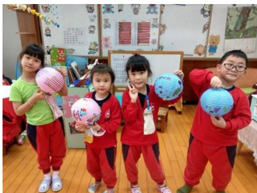
照片說明：鼓仔燈 拍攝日期：110 年 02 月 23 日