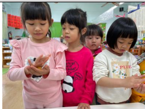
照片說明：小朋友用手掌圓做元宵的番薯餡 拍攝日期：110 年 02 月 25 日