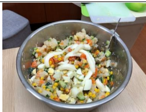
照片說明：馬鈴薯雞蛋沙拉 拍攝日期：110 年 3 月 16 日