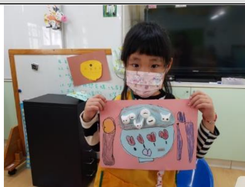
照片說明：元宵節的黏塗創作 拍攝日期：110 年 02 月 24 日