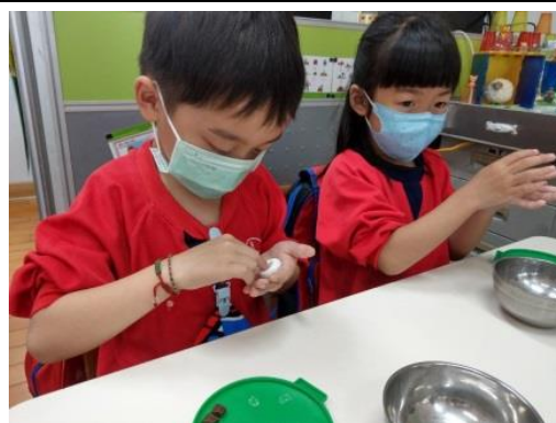
照片說明：掌巧克力口味元宵 拍攝日期：110 年 03 月 02 日