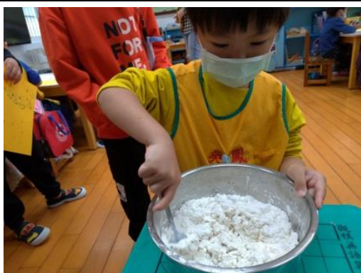
照片說明：糯米粉加水攪拌成圓仔粹 拍攝日期：110 年 03 月 02 日