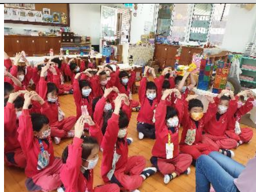
照片說明：疊柴角仔童詩搭配動作 拍攝日期：110 年 03 月 08 日