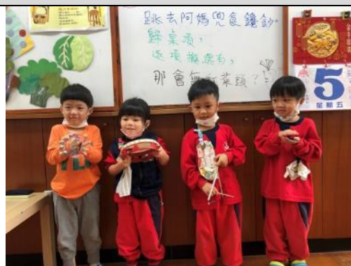
照片說明：因仔歌配搭樂器 拍攝日期：110 年 03 月 05 日