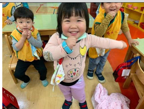
照片說明：囡仔模仿學習對阿公阿嬤動作特徵認知。 拍攝日期：110 年 03 月 04 日