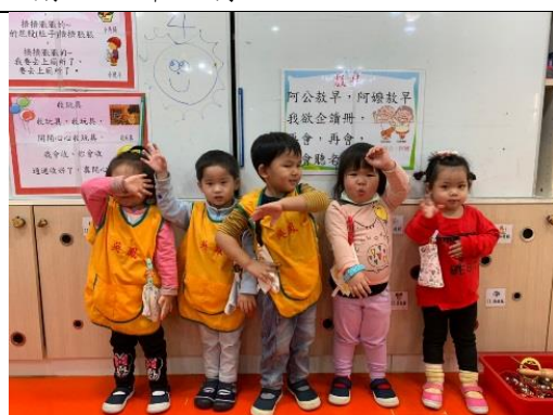
照片說明：囡仔唸唱兒歌結合肢體律動。 拍攝日期：110 年 03 月 11 日