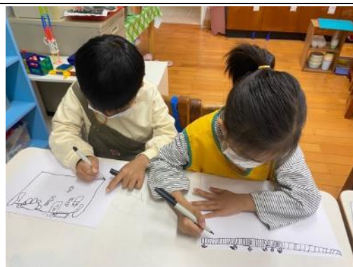
照片說明：參訪經驗畫圖分享 拍攝日期：110 年 03 月 11 日