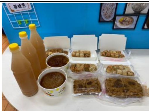
照片說明：東市場的美食分享 拍攝日期：110 年 03 月 10 日