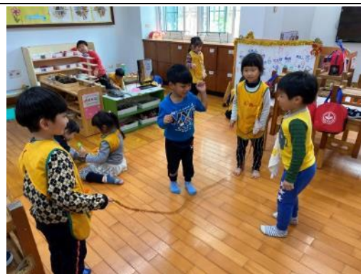
照片說明：研究跳索仔的方法 拍攝日期：110 年 03 月 04 日