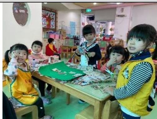
照片說明：設計健康的菜單 拍攝日期：110 年 03 月 03 日