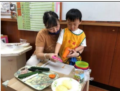
照片說明：馬鈴薯雞蛋沙拉 拍攝日期：110 年 03 月 16 日