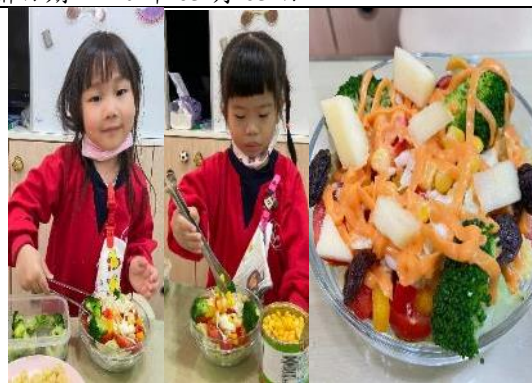
照片說明：青菜沙拉健康閣好食! 拍攝日期：110 年 03 月 18 日