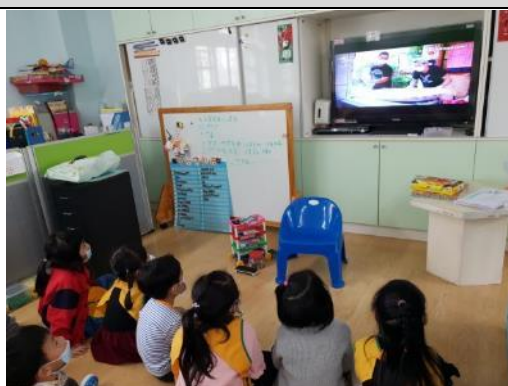
照片說明：看元宵節的影片 拍攝日期：110 年 02 月 23 日