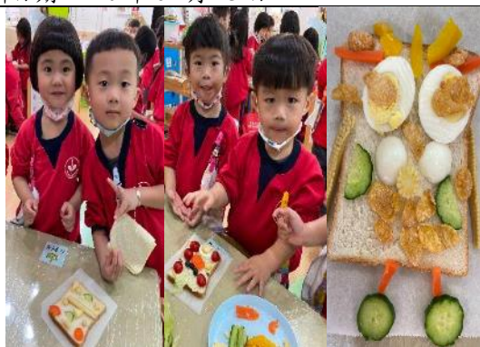
照片說明：做伙來食創意俗麩! 拍攝日期：110 年 03 月 11 日