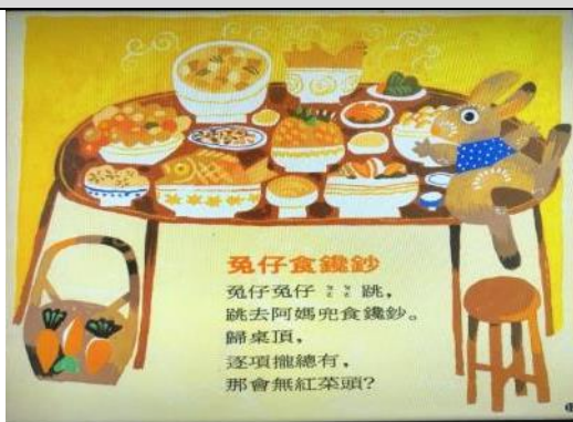
照片說明：閩南語因仔歌-兔仔食饞鈔 拍攝日期：110 年 02 月 26 日