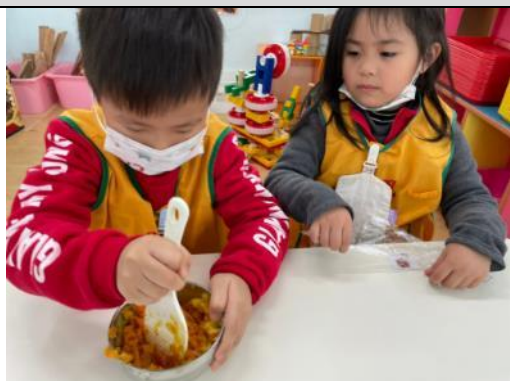
照片說明：予小朋友用飯匙舂碎番薯 拍攝日期：110 年 02 月 25 日