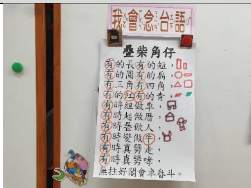
照片說明：我會念台語-疊柴角仔 拍攝日期：110 年 03 月 08 日