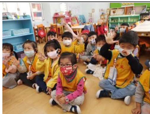
照片說明：擲手耍謎猜恰分享過元宵的生活經驗 拍攝日期：110 年 03 月 02 日