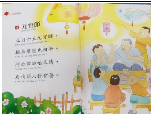
照片說明：元宵節的囡仔歌 拍攝日期：110 年 02 月 25 日