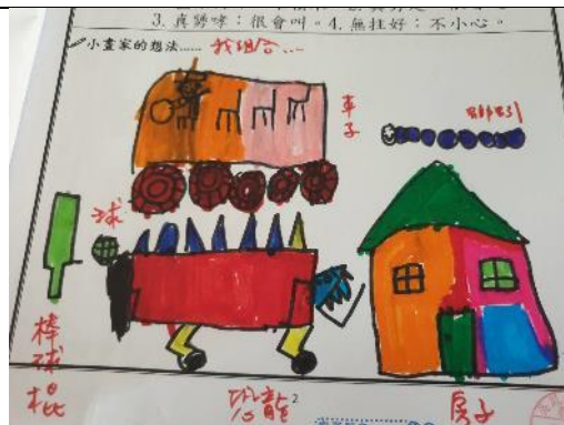
照片說明：小畫家-疊柴角仔，我可以組成 拍攝日期：110 年 03 月 12 日