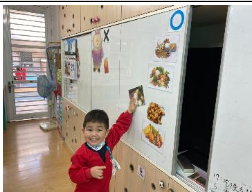
照片說明：紅燈停，青燈行 拍攝日期：110 年 02 月 23 日