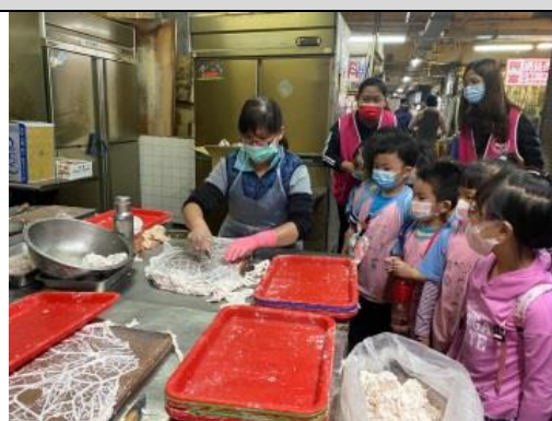
照片說明：佇東市場看肉捲怎麼做 拍攝日期：110 年 03 月 10 日