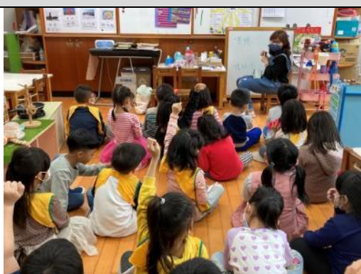
照片說明：孩子練習用閩南語來行前討論 拍攝日期：110 年 02 月 26 日