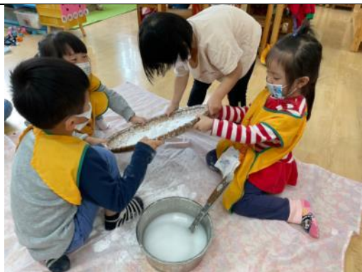
照片說明：小朋友利用竹篩俗秫米粉籖番薯餡 拍攝日期：110 年 03 月 02 日