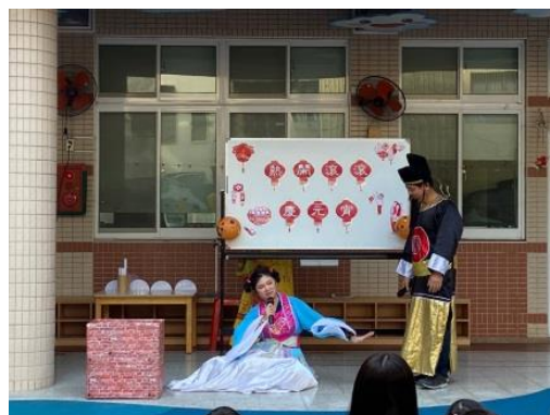
照片說明：欣賞元宵節由來的表演 拍攝日期：110 年 02 月 24 日