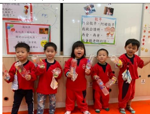
照片說明：囡仔唸唱兒歌結合樂器敲奏 拍攝日期：110 年 03 月 12 日