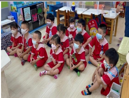
照片說明：聽故事學閩南語-怕浪費的奶奶 拍攝日期：111 年 09 月 23 日