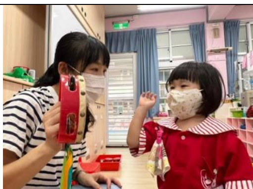
照片說明：語言發展遲緩囡仔，馬會曉講早 拍攝日期：111 年 09 月 29 日