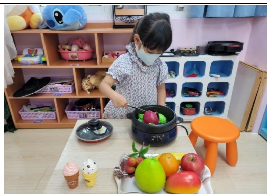
照片說明：在扮演區練習說出形容食物的語詞