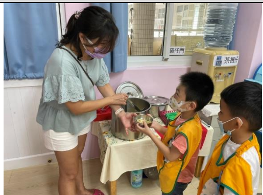
照片說明：下晡食燒滾滾的麵