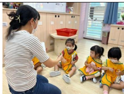
照片說明：漸漸增加問候話語對話語句長度 拍攝日期：111 年 10 月 05 日