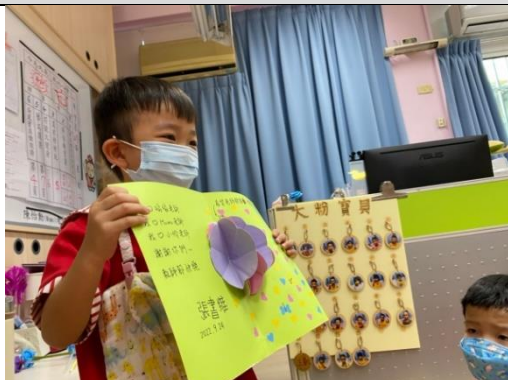
照片說明：恰阿母作伙做ê卡片 感謝老師ê照顧 拍攝日期：111 年 09 月 26 日