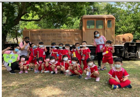
照片說明：參觀阿里山車庫園區的火車 拍攝日期：111 年 09 月 30 日