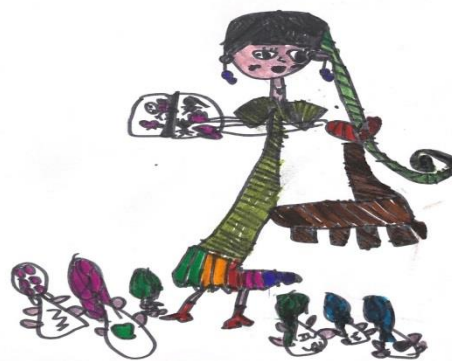
照片說明：繪畫：老師逐工ê工課~講故事 拍攝日期：111 年 10 月 03 日