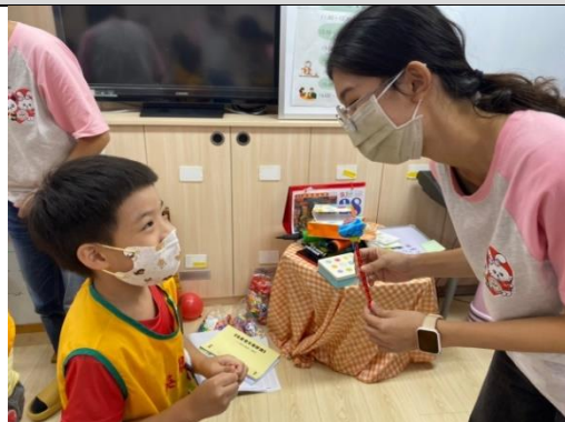
照片說明：送老師 我親手做ê原子筆花 拍攝日期：111 年 09 月 27 日