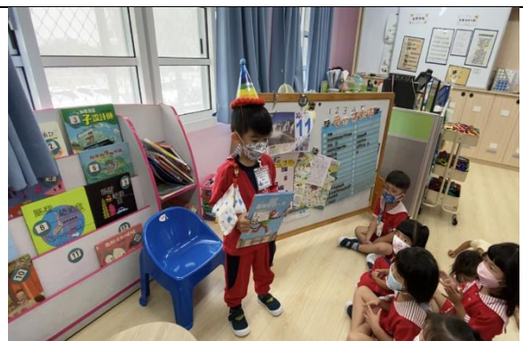
照片說明：10 月份慶生會 拍攝日期：111 年 10 月 11 日