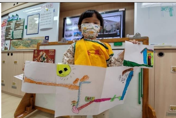
照片說明：到公園迤迤的方向地圖 拍攝日期：111 年 09 月 20 日