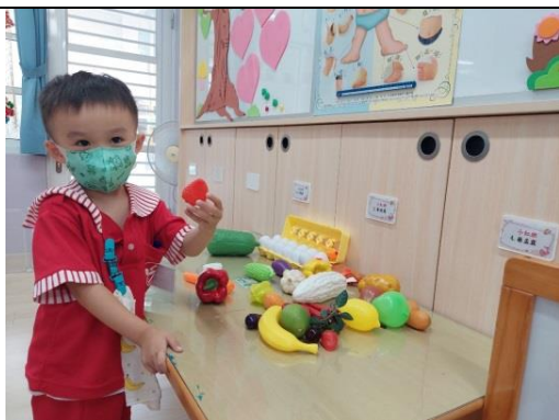
照片說明：挑自己愛呷物件 拍攝日期：111 年 10 月 04 日