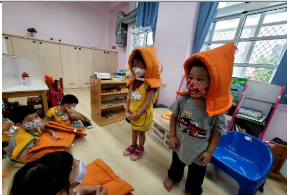
照片說明：防震演練 拍攝日期：111 年 09 月 14 日