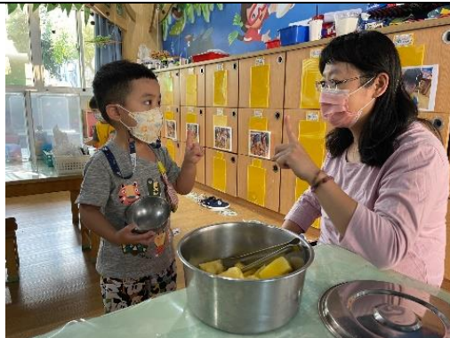
照片說明：水果數量名稱 拍攝日期：111 年 10 月 12 日