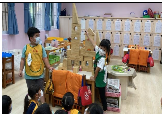
照片說明：紹介合作創作的賣票服務台 拍攝日期：111 年 10 月 07 日