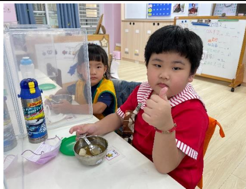
照片說明：我上愛食點心 拍攝日期：111 年 10 月 14 日