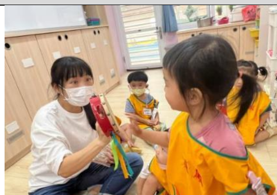
照片說明：逐工的例行活動開始會曉講𪗇早 拍攝日期：111 年 09 月 15 日