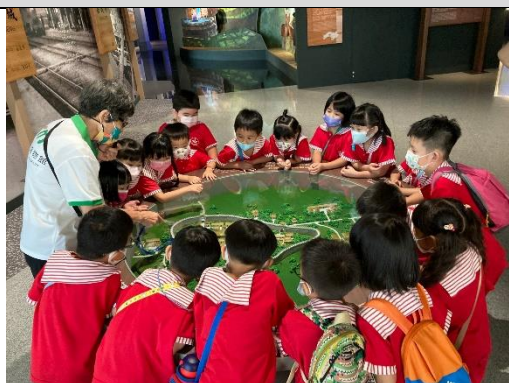
照片說明：認捌嘉義的古城名稱~桃城 拍攝日期：111 年 09 月 30 日