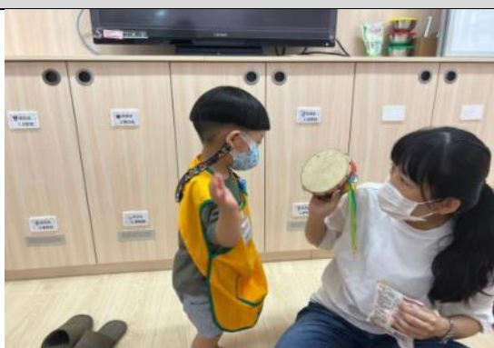
照片說明：認捌老師佢老師問早 拍攝日期：111 年 08 月 31 日