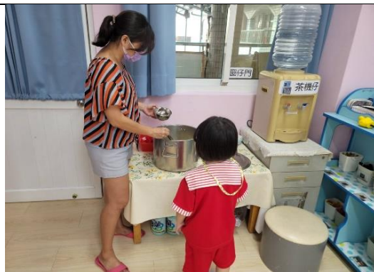
照片說明：下晡食甜物物的豆花