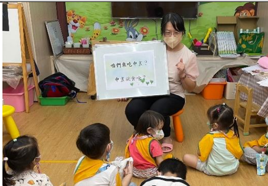
照片說明：咱們來吃中晝？ 拍攝日期：111 年 09 月 27 日