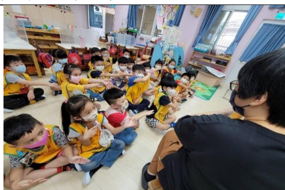
照片說明：囡仔比出老師指定的方向 拍攝日期：111 年 10 月 12 日