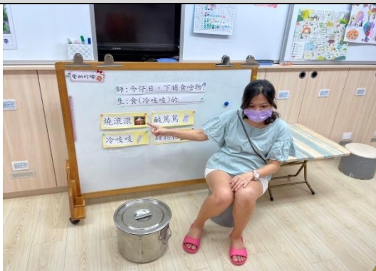
照片說明：練習句型與四個形容詞