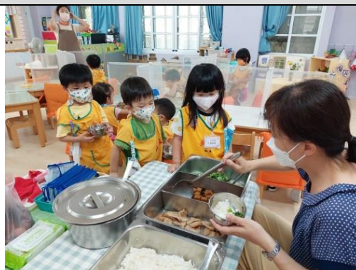
照片說明：逐天吃飯前逐家攏來練講閩南語 拍攝日期：111 年 09 月 19 日