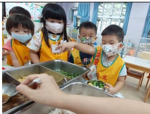
照片說明：自己講出自己袂吃物件 拍攝日期：111 年 10 月 06 日