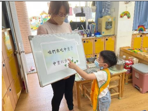
照片說明：中晝欲食啥？ 拍攝日期：111 年 09 月 27 日