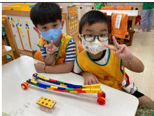
照片說明：合作運用材料設計火車 拍攝日期：111 年 10 月 07 日