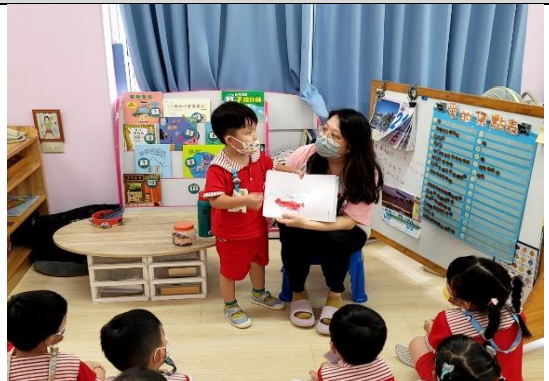
照片說明：分享地震的經驗 拍攝日期：111 年 09 月 21 日