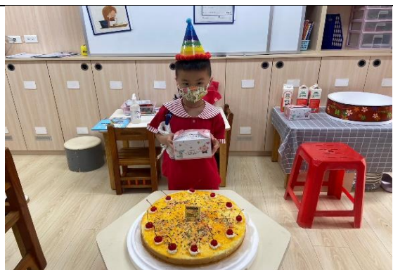
照片說明：10 月份慶生會 拍攝日期：111 年 10 月 07 日