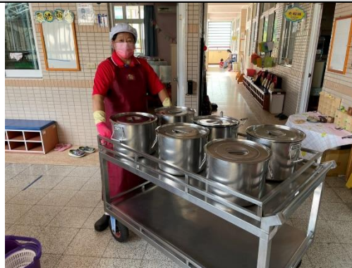
照片說明：感謝辛苦的廚房阿姨 拍攝日期：111 年 09 月 30 日