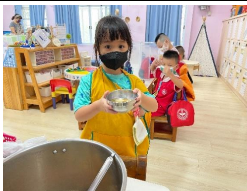
照片說明：點心時間-欲食大碗抑是細碗 拍攝日期：111 年 10 月 07 日