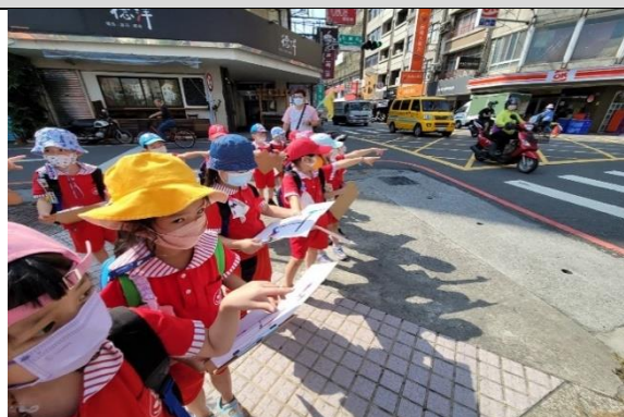
照片說明：囡仔紮地圖，做伙看地圖出發到公園 拍攝日期：111 年 09 月 27 日