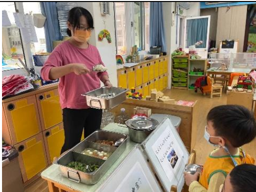
照片說明：白米飯、薤菜、煎蛋菜色名稱 拍攝日期：111 年 10 月 04 日