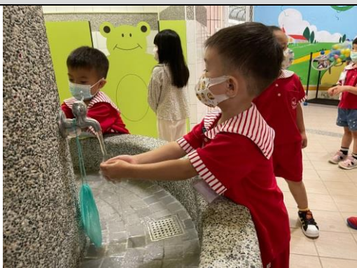
照片說明：呷飯前，逐家攏要去水槽仔洗手 拍攝日期：111 年 09 月 02 日