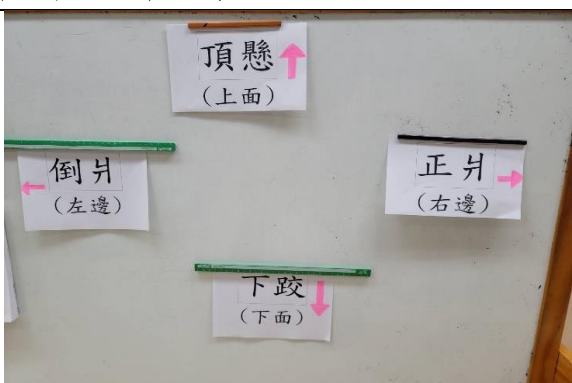
照片說明：佇教室著加強方向 拍攝日期：111 年 10 月 11 日