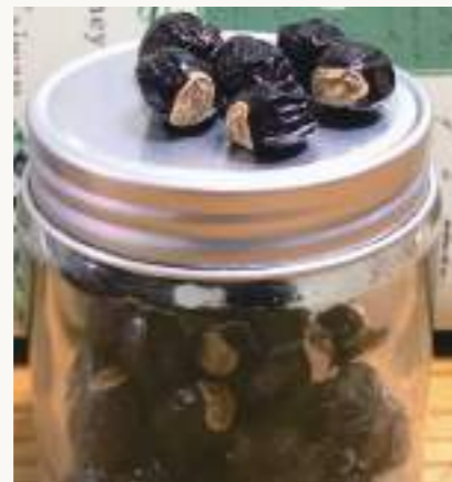
圖3. 龍眼果實似龍目,古詩云「圓如驪珠,赤若金丸,肉似玻璃,核如黑漆」。

荔枝椿象( Tessaratoma papillosa )屬半翅目(Hemiptera)、荔椿科(Tessaratomidae),為荔枝及龍眼常見的害蟲,分布於泰國、越南、寮國、香港及中國等地,遲至1997年首次在金門發現,2009年則首次在臺灣高雄發現,目前除澎湖縣尚未發現、臺東縣、花蓮縣零星分布外,已經在臺灣各縣市普遍發生,其寄主植物主要為無患子科(Sapindaceae)植物包含荔枝( Litchi chinensis )、龍眼( Dimocarpus longan )、無患子( Sapindus mukorossi )及臺灣欒樹( Koelreuteria henryi )等四種喬木。